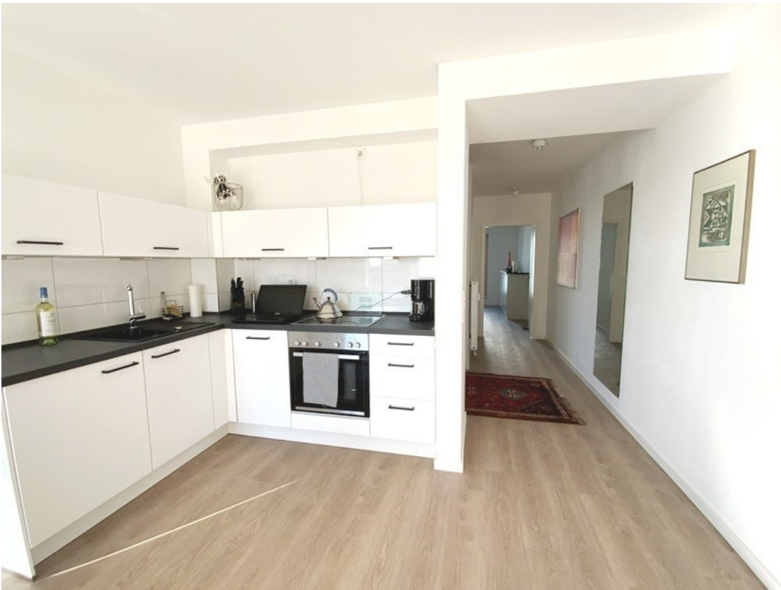
Küche mit Diele