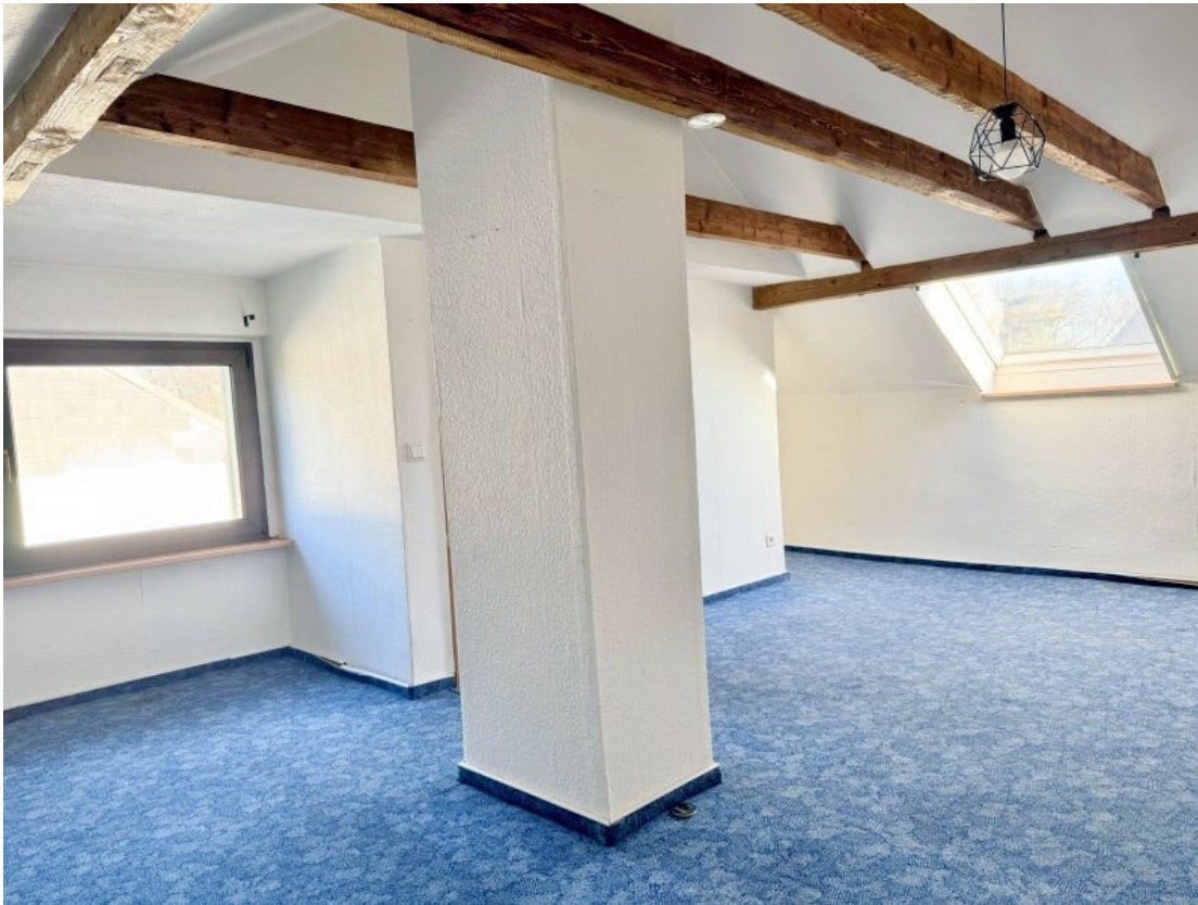
wohlich gestaltete Nutzfläche 2