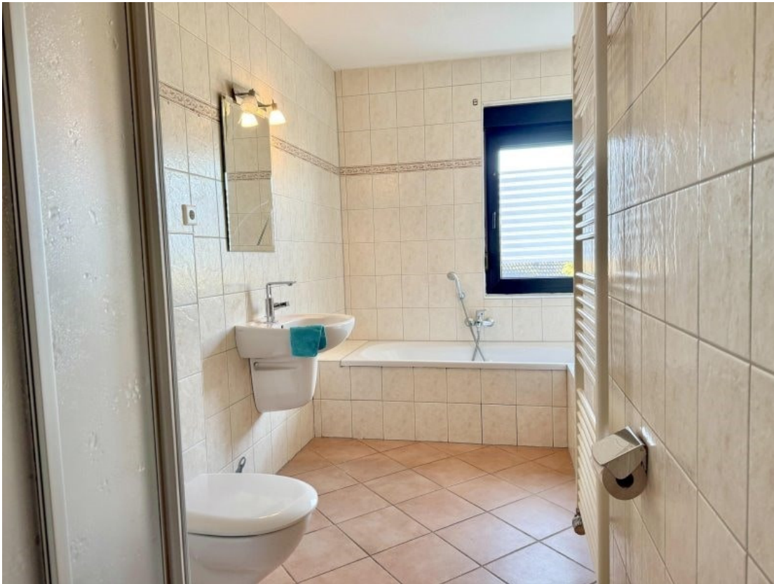
Dusch- und Wannenbad