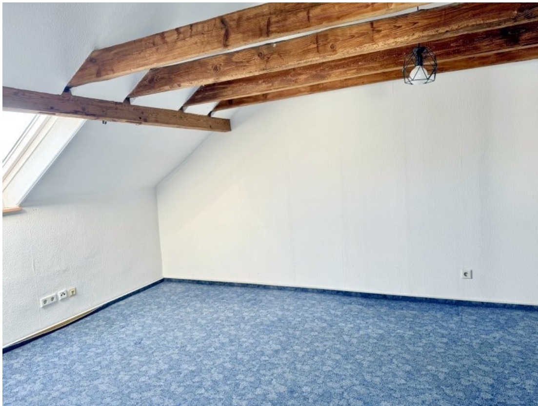
wohlich gestaltete Nutzfläche 1