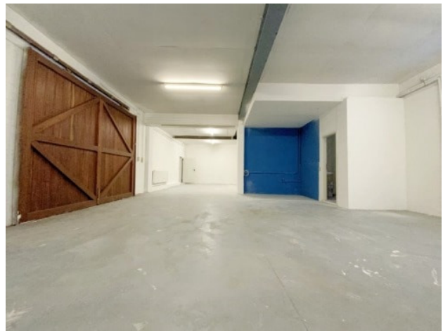
Lagerraum mit Toranlage