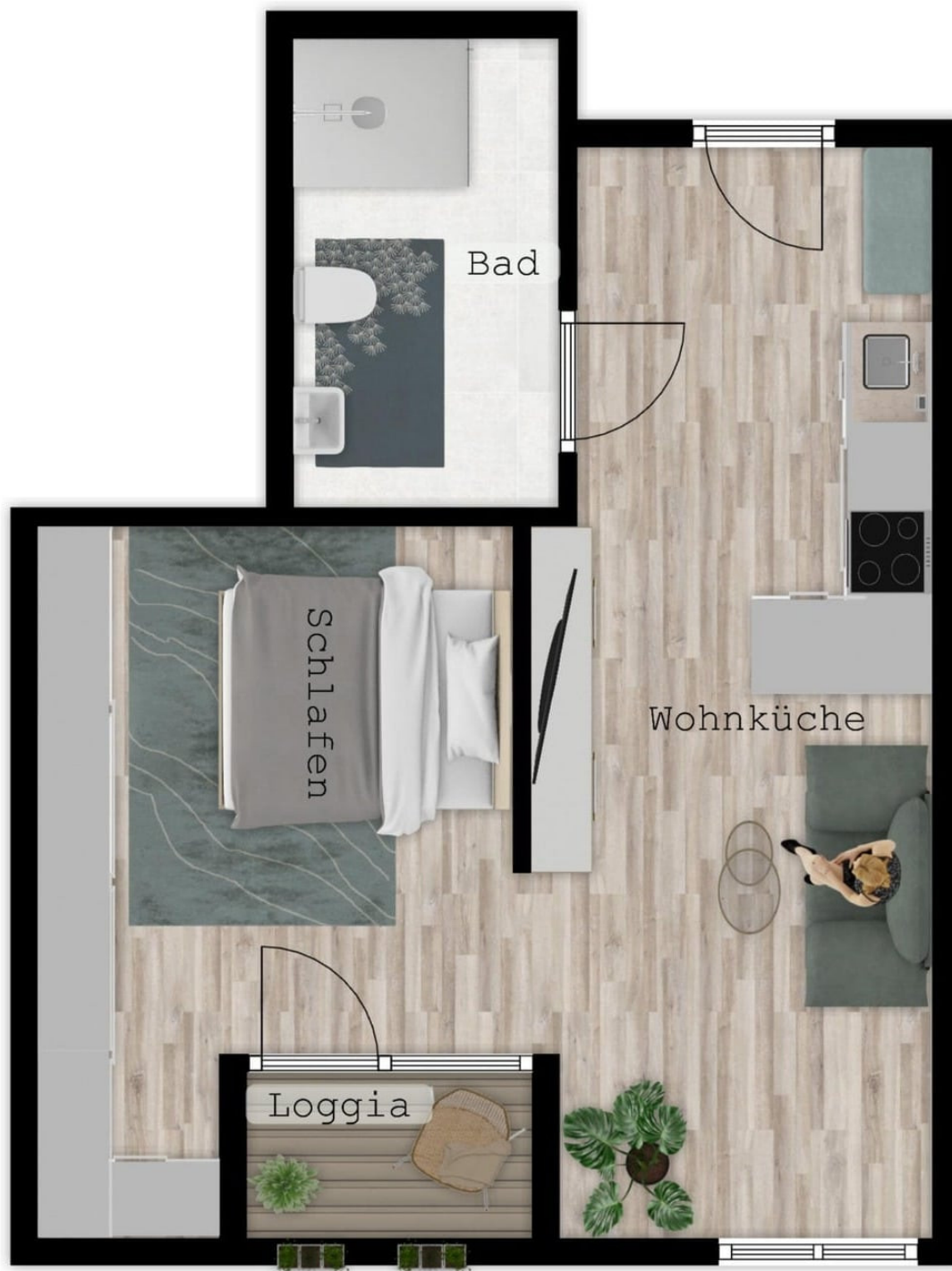
EG Whg. 03